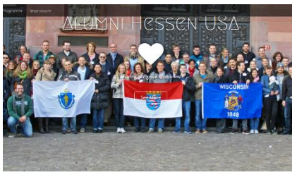
Alumniveranstaltung – 22. April 2016 Bleib auf dem Laufenden mit dem Alumni Newsletter! Like Alumni, tell us in several ways: on 22. April 2016, bring the old and new Alumni organization in Hessen to the attention of the Hessian and German Webmaster. Please do not miss the chance to share your experiences and suggestions in our discussion forum. This program is not for sale. Do not take any action.

Auf unserer Webseite https://www.alumni-hessen-usa.de informieren wir euch über aktuelle Treffen und Aktionen. Hier könnt ihr euch auch über unser Buddy Programm informieren und alle bevorstehenden Termine einsehen. Darüber hinaus könnt ihr euch in den E-Mail Verteiler aufnehmen lassen, damit ihr immer „up to date“ seid. Schaut es euch an!